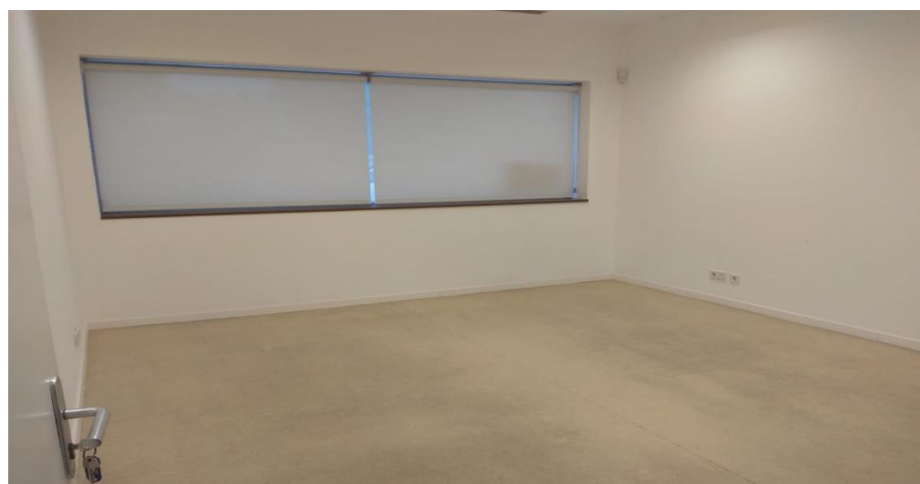
Imagen 3 Imagen interior de la oficina 0.4