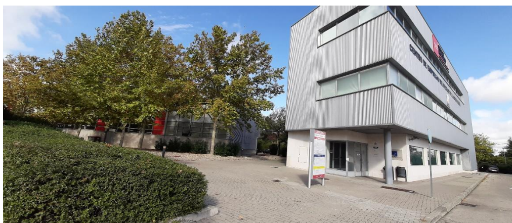
Imagen 2 Imagen exterior del edificio D. Oficinas