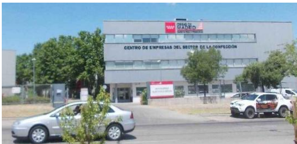
Imagen 1 Imagen exterior del edificio D oficinas