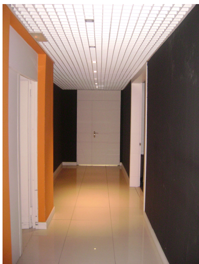
Distribuidor de planta