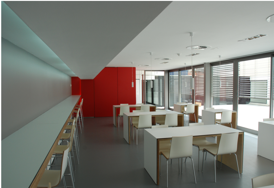
Vista interior zona office