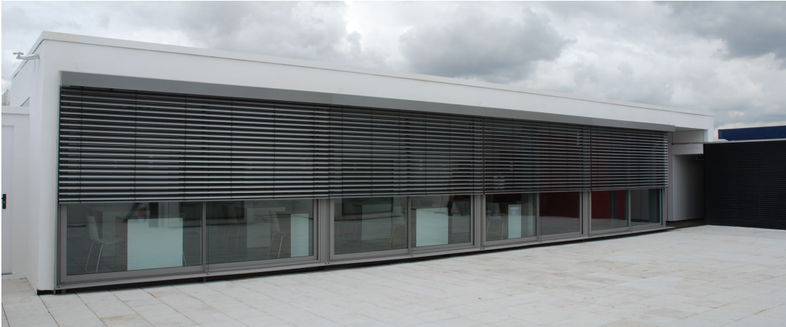
Vista exterior zona office