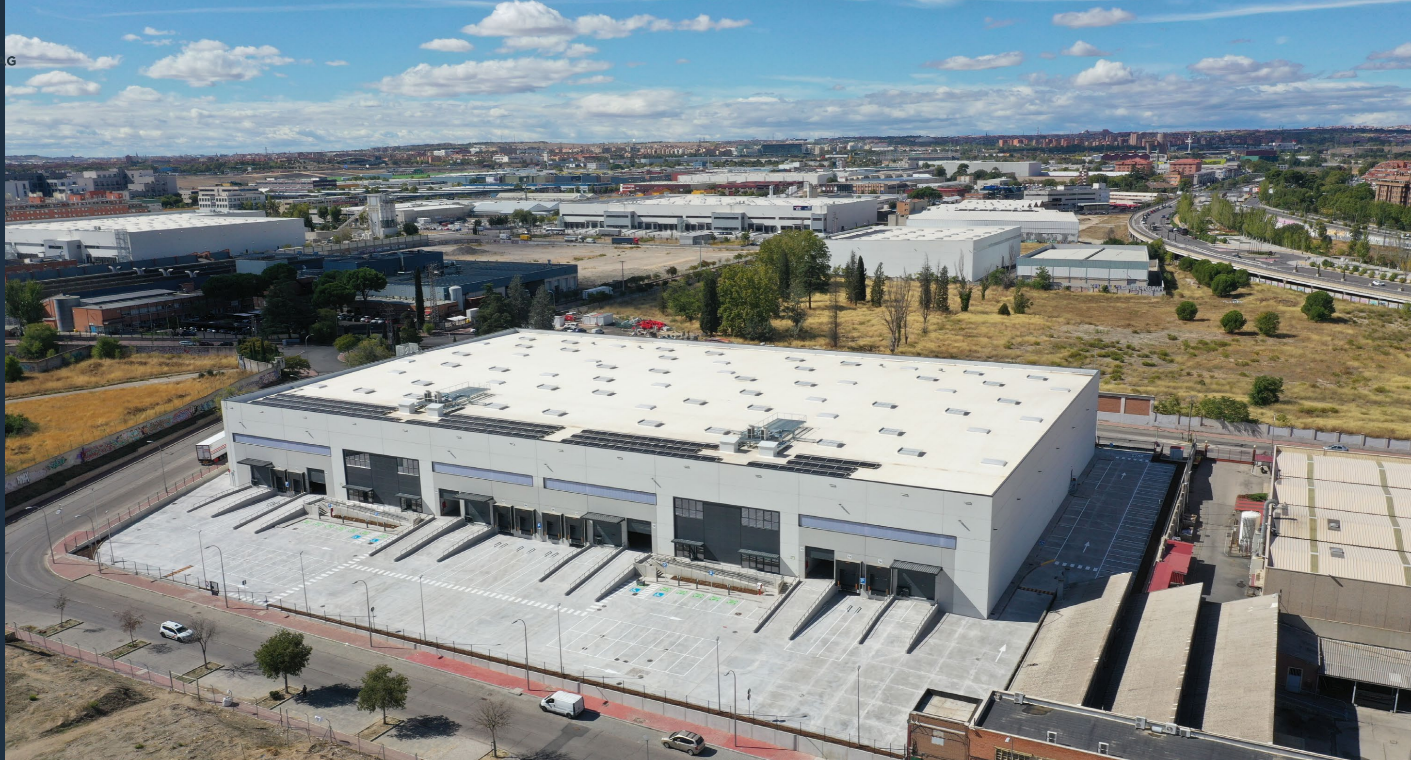
ENGEL, VILLAVERDE III