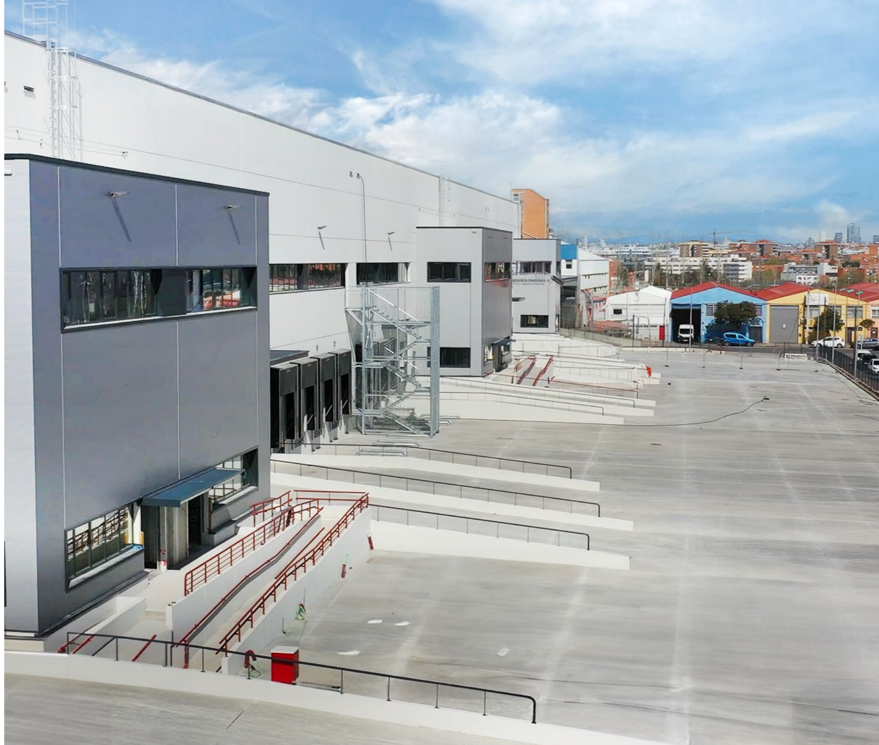
FACTORY, VILLAVERDE I