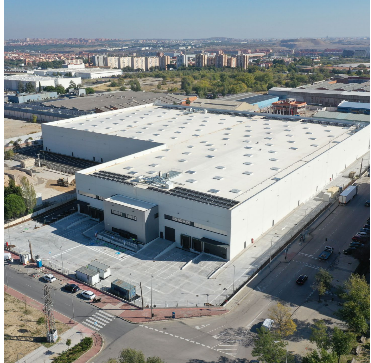
FAURECIA, VILLVERDE II