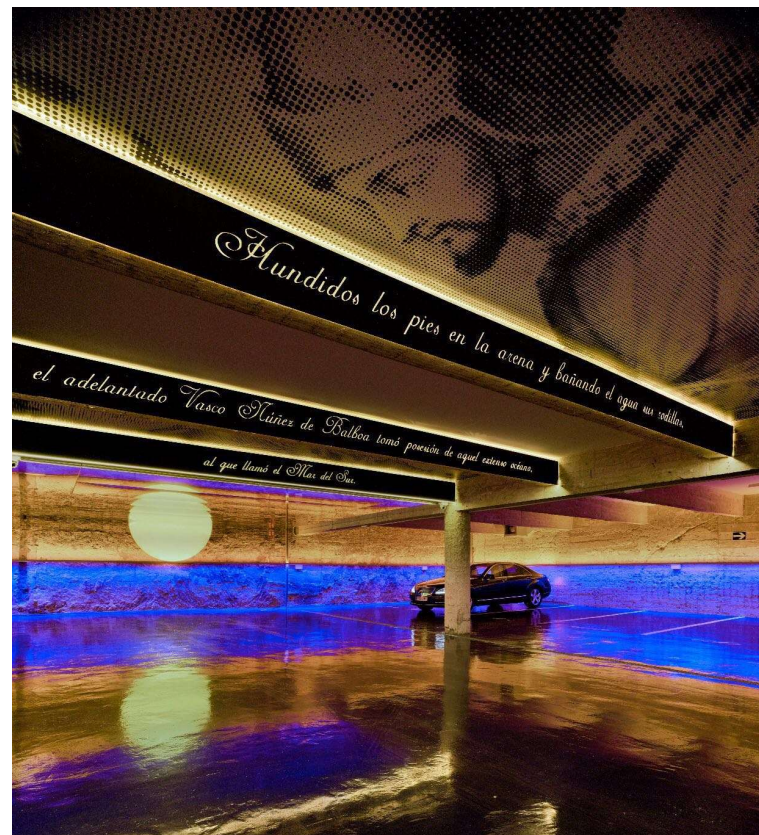
ORBIT PARKING - NÚÑEZ DE BALBOA 52

Damos un 15% de descuento en nuestro parking para nuestros clientes.