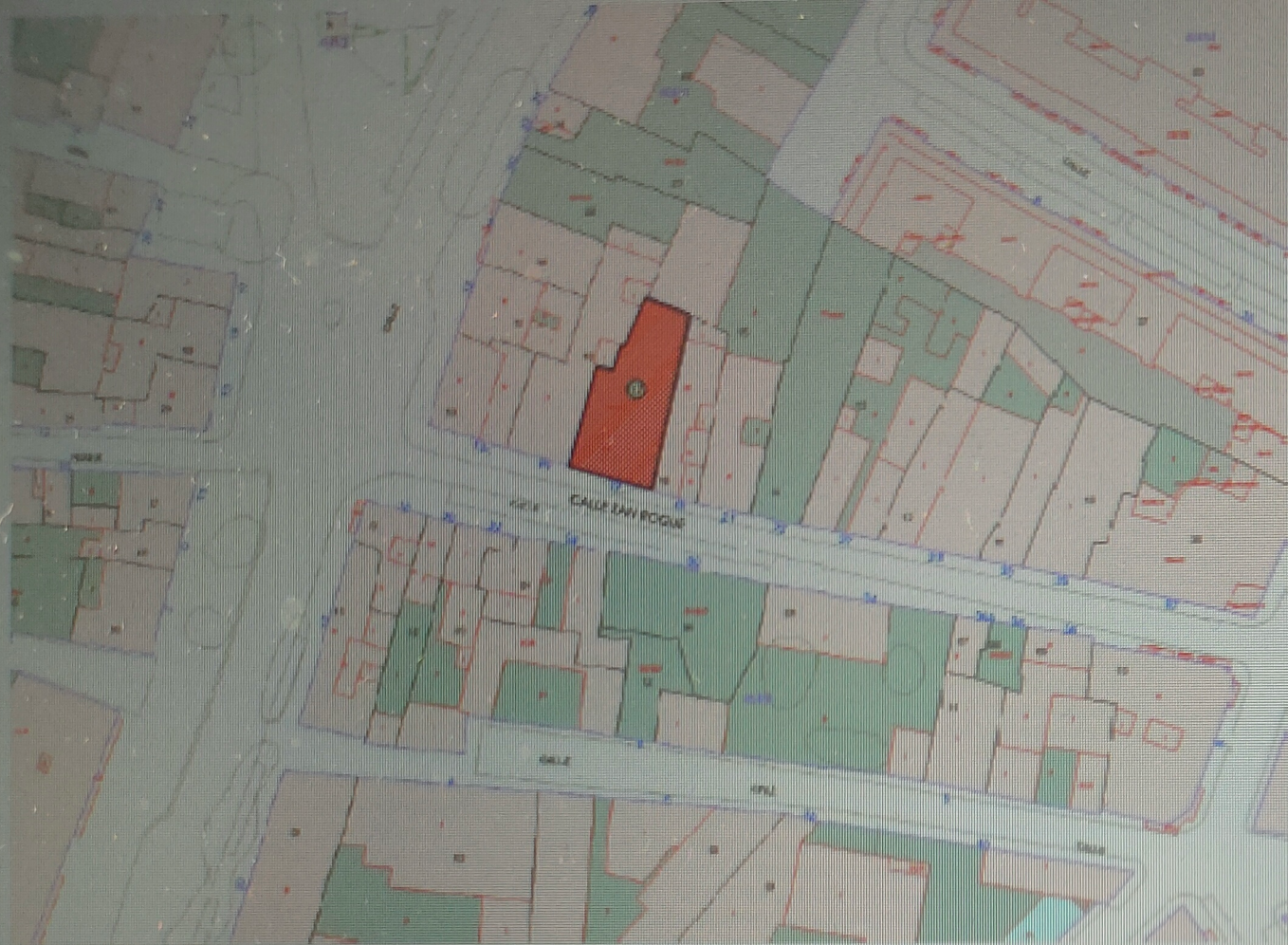
EMPLAZAMIENTO a: 1/500