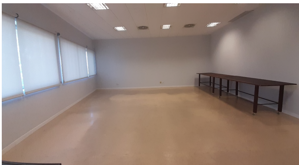
Imagen 3 Imagen interior de la oficina 2.8