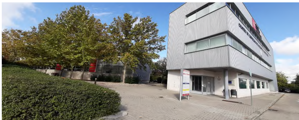
Imagen 2 Imagen exterior del edificio D Oficinas