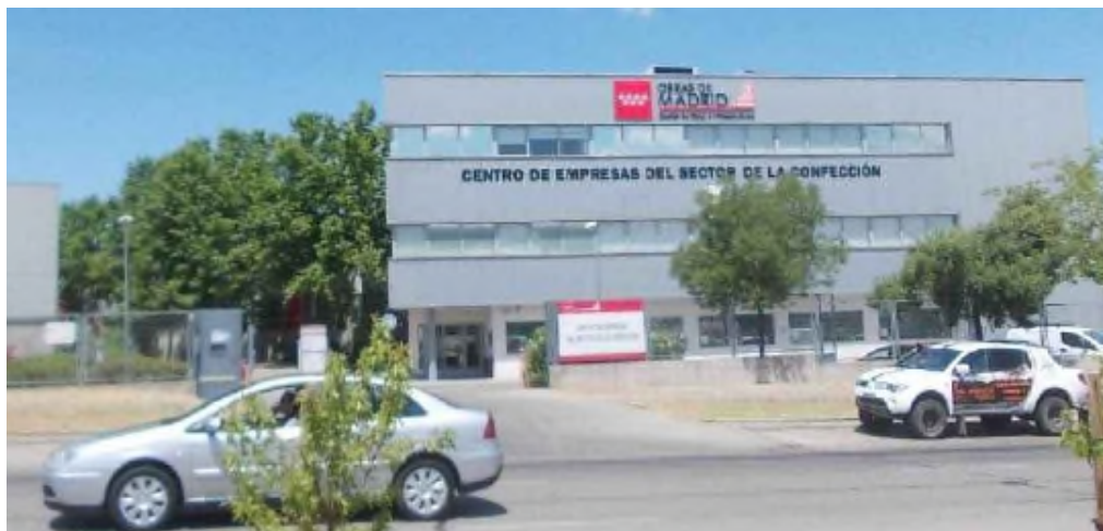
Imagen 1 Imagen exterior del edificio D oficinas