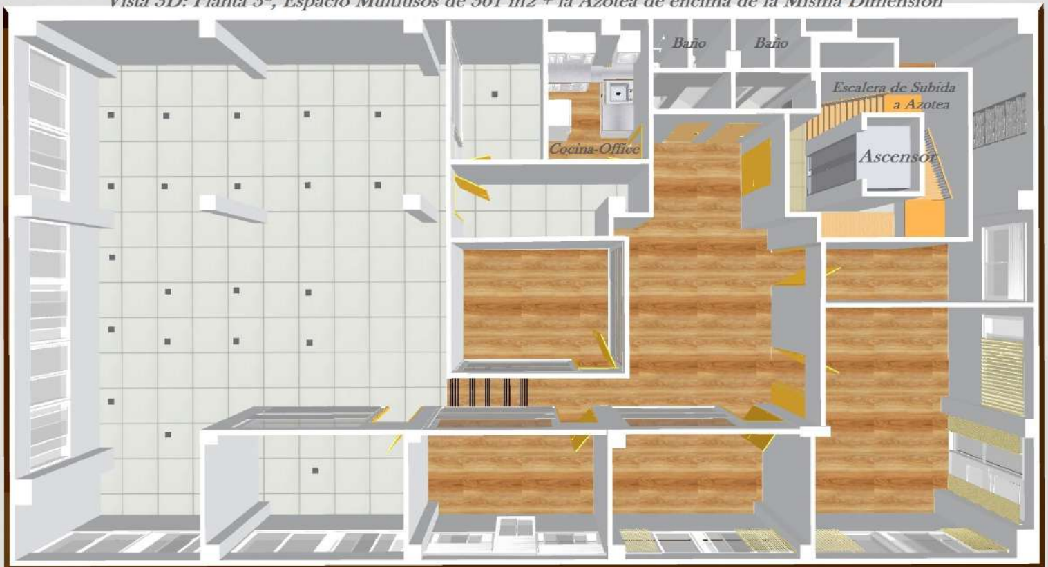
Vista 3D: Planta 3ª, Espacio Multiusos de 361 m 2 + la Azotea de encima de la Misma Dimensión