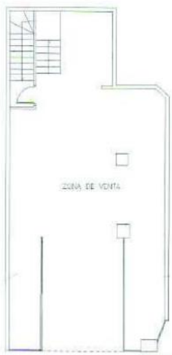
Calle Bravo Murillo