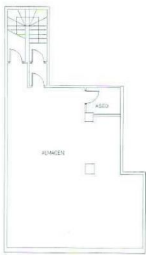
Calle Bravo Murillo